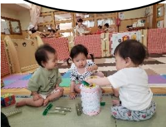
友達の持っている物が気になります。次に持っている人が気になり始めると取り合いや要求が出てきて人との関わりを広げていきます