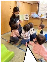
先生の絵本に集まってきました

保育園は同年齢、異年齢、保育士等、たくさんの人との関わりの中から人格形成の基礎を培う場所です。ひよこ組の子ども達は保育士との信頼関係が心の安心基地となり、いろいろな遊びを楽しんでいます。