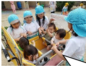
お姉さんたちに囲まれて嬉しそう。