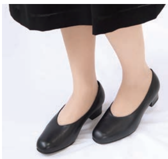
プレーンタイプ 「プレミアムパンプス」 18,700円(税込)