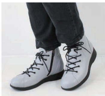
ハイカットブーツ 「ナポリ」 25,300円(税込)