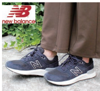
ニューバランス 「WW880」 13,970円(税込)