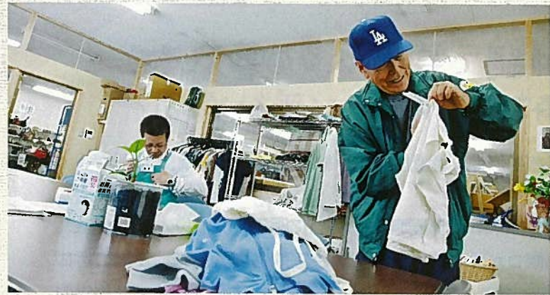
「ファイバーリサイクルセンター」では届けられた衣類を入居者が仕分けま

グリーンコープ生協の組合員活動から生まれた、ホームレスの自立を支援する住まい「抱樸館」。今号は抱樸館での生活支援をご紹介します。