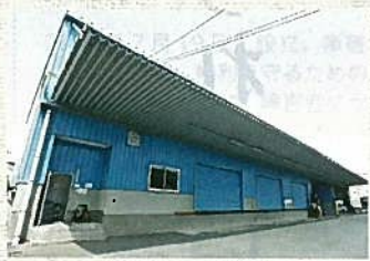
「ファイバーリサイクルセンター」の外観